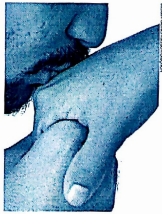
É marcante e comum nas suas diversas formas.

Para o psicólogo Renato Costa, o ato de beijar não é involuntário. Ninguém beija por beija. "Beija-se para dar ou outra uma pista de nossas intenções. Beijo de mãe ou pai nos filhos é de afeto, de amor; entre amigos, a amizade... Já o beijo em casal funciona como um termômetro. Pode ser o início de uma relação, se o beijo for bom para ambos, ou o final. Quando um casal já não se beija é o indicio que algo está errado", diz.